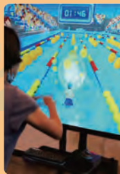
iTraining 互動復康運動系統