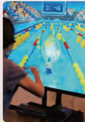
iTraining 互動復康運動系統